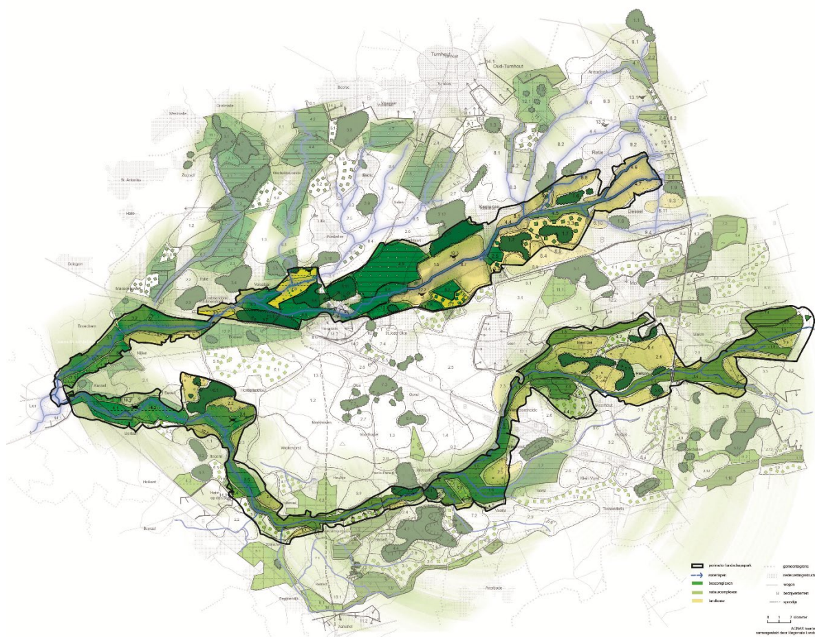
Figuur 3: perimeter kandidaat Landschapspark Kleine en Grote Nete

Het samenwerkingsverband Kleine Nete beschouwt de oproep voor kandidaturen Landschapsparken en Nationale Parken als een zeldzame kans om de werking en dynamiek in de vallei op een structurele manier en voor de langere termijn te verankeren. Uiteraard ook omdat het werkingsgebied ruimschoots voldoet aan de selectiecriteria werd een kandidatuur uitgewerkt en ingediend. Om de maturiteit van het voorstel te vergroten, werden de valleien van de Kleine en Grote Nete gebundeld tot één kandidatuur. De conceptnota vindt u als bijlage 7 bij deze rapportage.