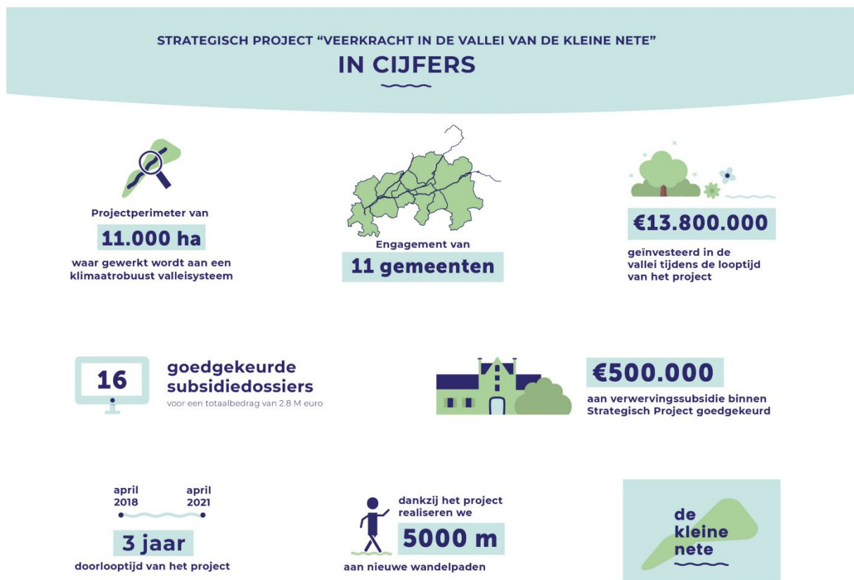
Figuur 1: samenvattende infografiek strategisch project Kleine Nete I

Onderstaande infografiek toont de realisaties mede onder impuls van dit strategisch project.